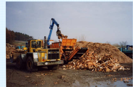
Zerkleinern des Treibholzes

Das Treibholz wird je nach Zugänglichkeit und Wasserstand mit unterschiedlichen Methoden in Grosscontainer verladen und zur Weiterverarbeitung transportiert. Die Treibholzmenge und ihre Beeinträchtigung des betroffenen Uferabschnittes bestimmen die Priorität des Einsatzes.