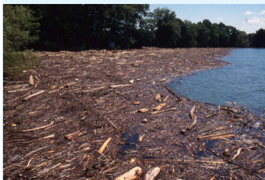
Treibholz am Bodenseeufer